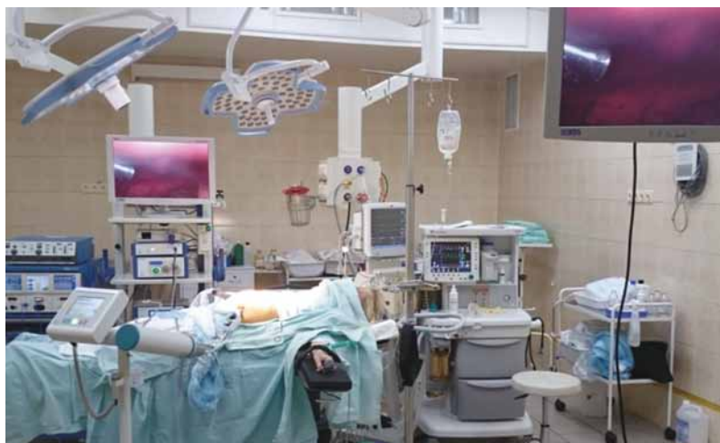
Рис. 2. Общий вид операционной во время сеанса PIPAC